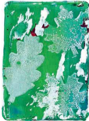
von Lara Steinhauer; Druck mit Gelplatte unter Anleitung von Heike Pander

Ich war nie wieder in der Stadt, und dann verbringe ich den Rest meines Lebens bei der Familie.