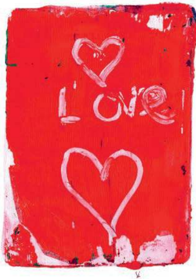
von Lara Steinhauer; Druck mit Gelplatte unter Anleitung von Heike Pander

Ich habe es erst mal ganz locker aufgenommen, obwohl ich in diesem Moment hätte losheulen können. Ich habe ihn dann die ganze