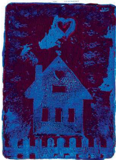
von Lara Steinhauer; Druck mit Gelplatte unter Anleitung von Heike Pander

„Ja klar, meine süße Maus“, sagte meine Oma zu mir. Ich und Oma sind zuerst in die Küche gegangen, und die war dieses Mal so groß und rot, na ja, rot war sie schon immer, aber groß. „Boah“, war sie